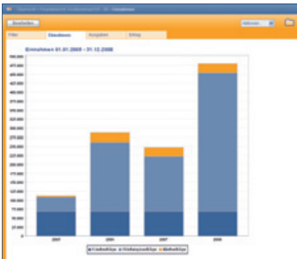
Einnahmen ausgewählter Vertragstypen als grafische Auswertung